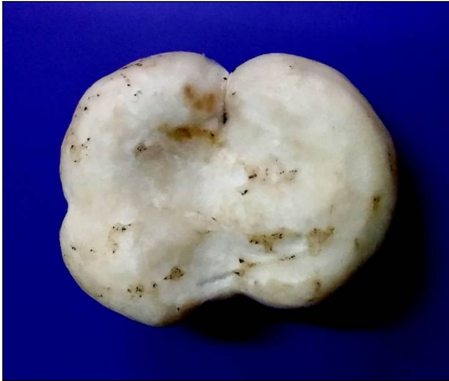
Рис. 39. Груздь войлочный (вид сверху)