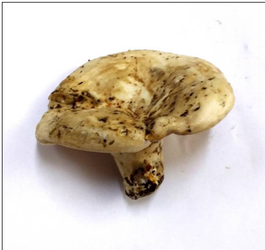
Рис. 22. Подгруздок белый (фото для определения)