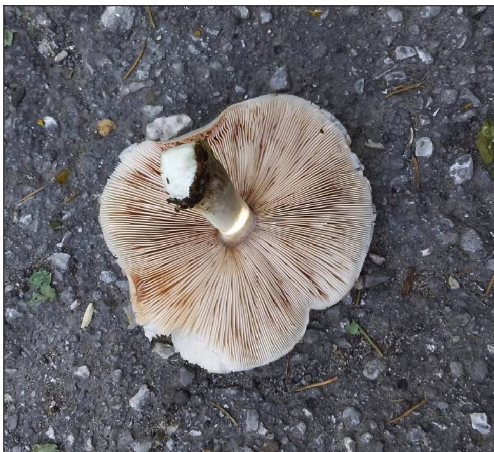
Рис. 13. Плютей белый (вид снизу)