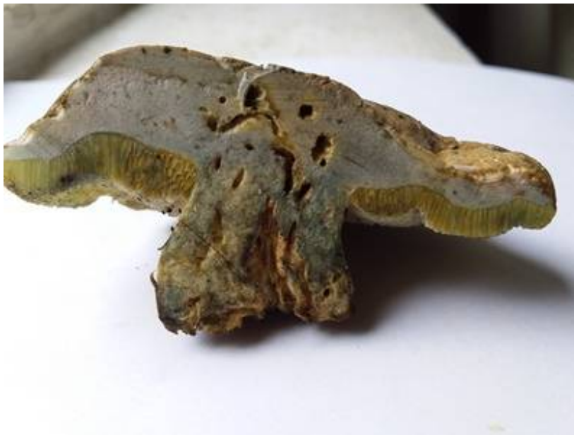
Рис. 34. Дубовик обыкновенный (в разрезе)