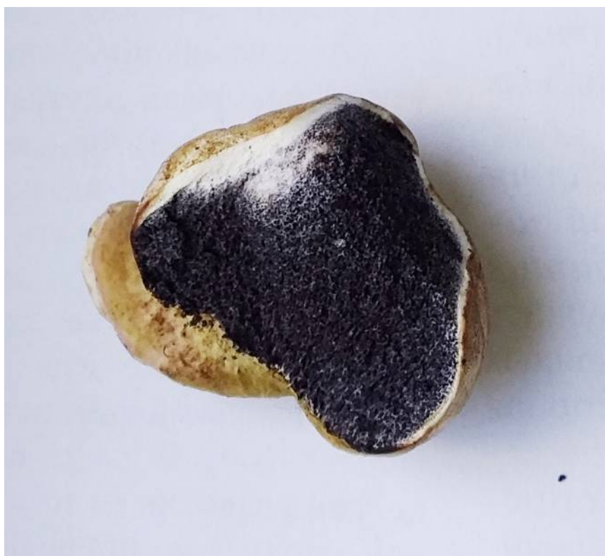
Рис. 36. Ложнодождевик обыкновенный (в разрезе)