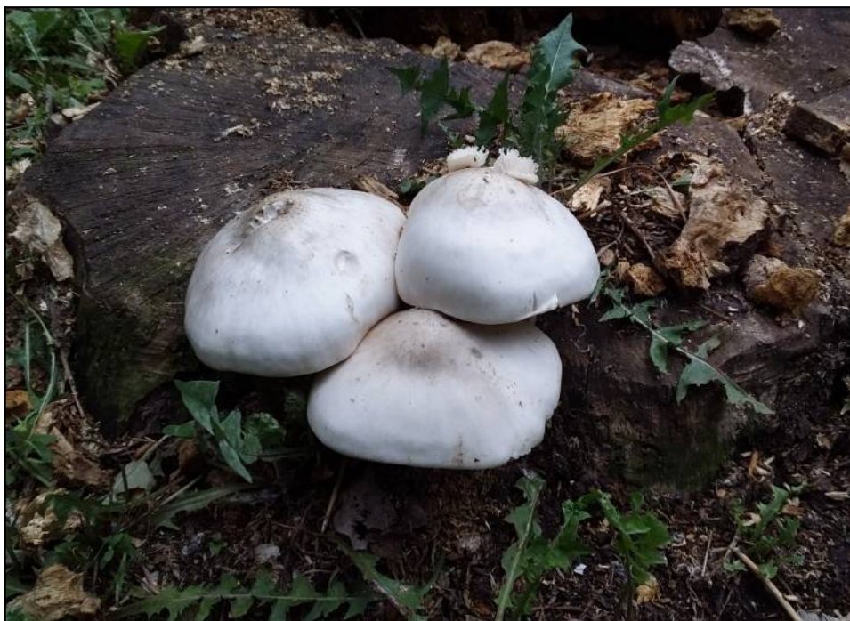
Рис. 12. Плютей белый в месте произрастания