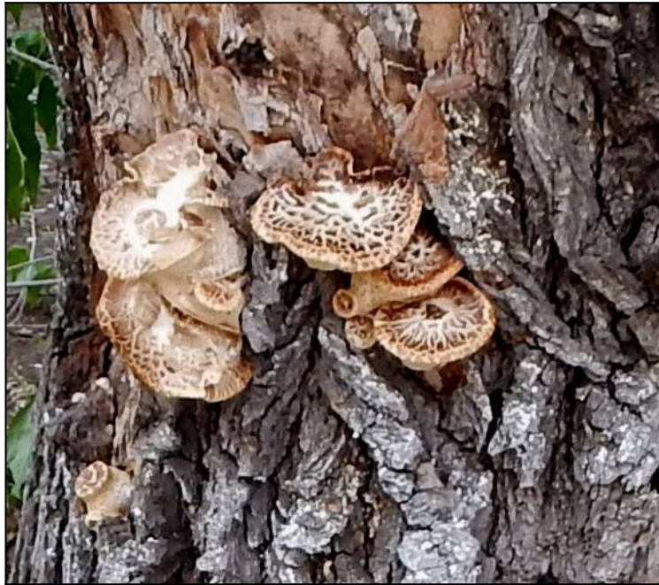
Рис. 8. Трутовик чешуйчатый в молодом возрасте