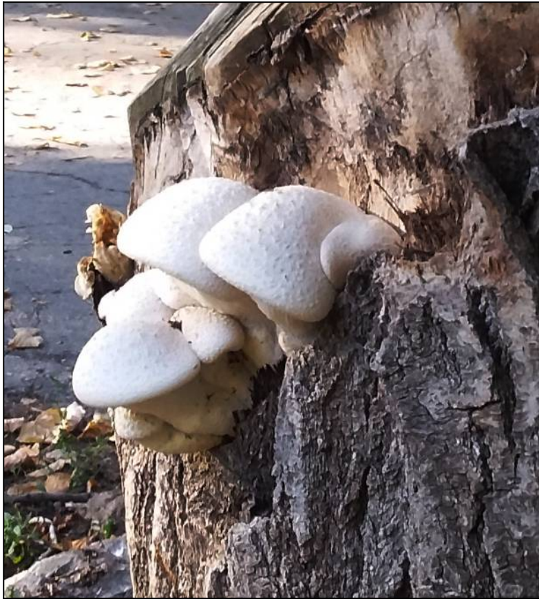
Рис. 25. Чешуйчатка разрушающая в месте произрастания