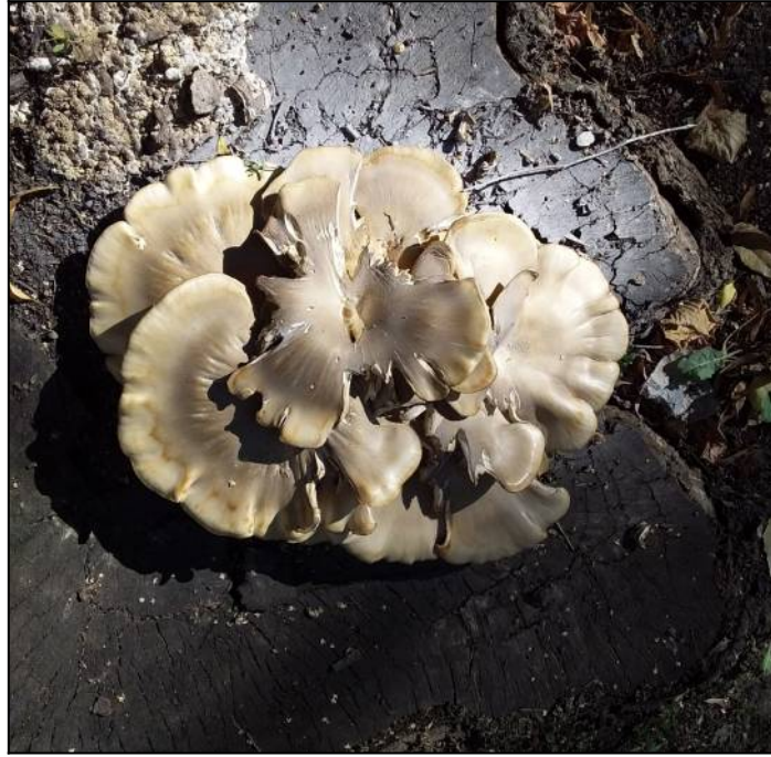
Рис. 19. Вёшенка лесная (обыкновенная) в месте произрастания