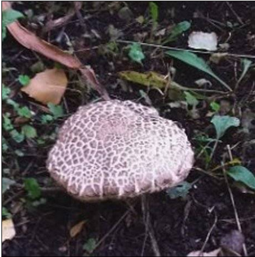
Рис. 17. Моховик трещиноватый в месте произрастания