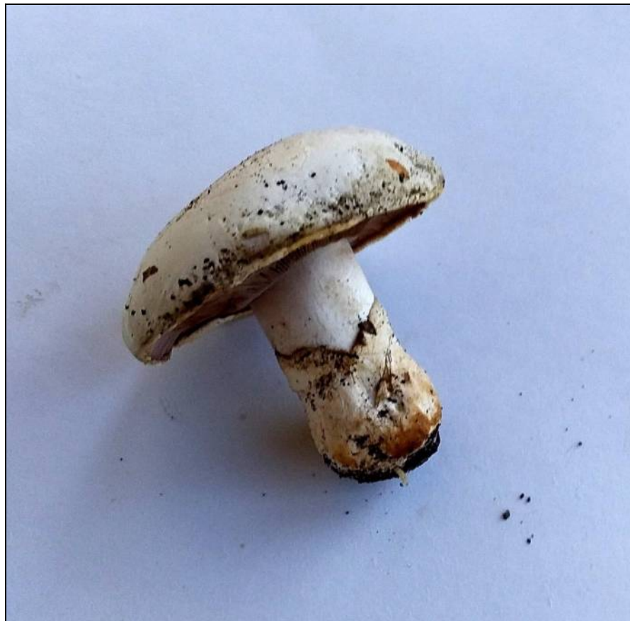
Рис. 24. Шампиньон двуспоровый (фото для определения)