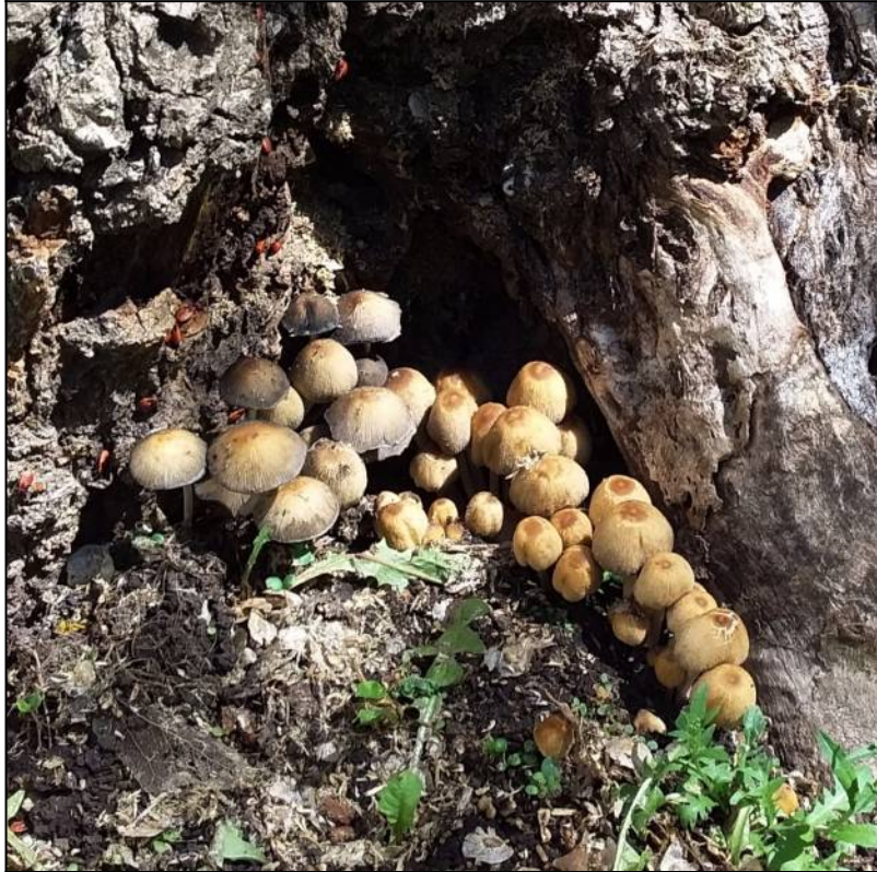
Рис. 6. Навозники обыкновенные в месте произрастания