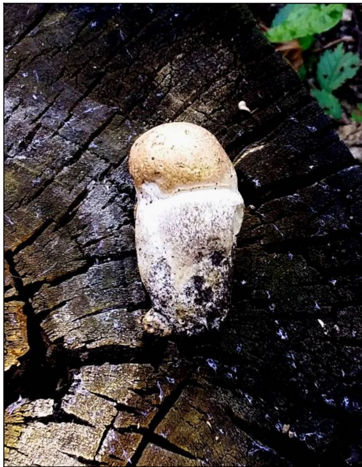
Рис. 20. Подберёзовик обыкновенный