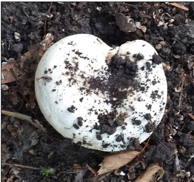
Рис. 38. Груздь войлочный в месте произрастания