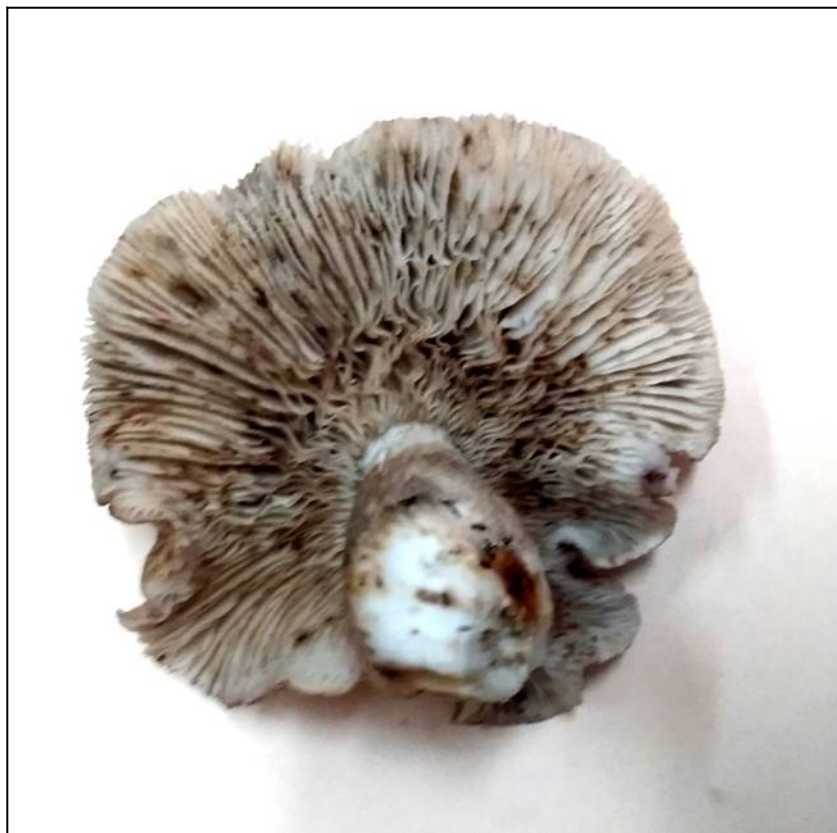
Рис. 28. Рядовка тополёвая (вид снизу)