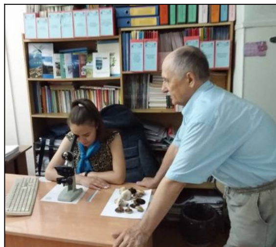
Рис. 4. Иконографическое определение видовой принадлежности гриба