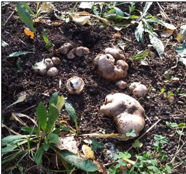
Рис. 26. Рядовка тополёвая в месте произрастания