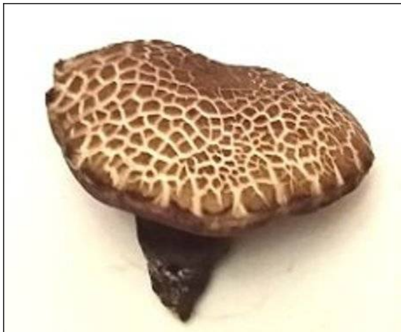
Рис. 18. Моховик трещиноватый (классический)