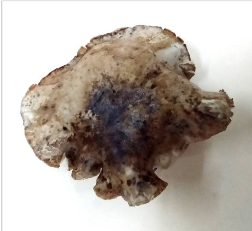
Рис. 27. Рядовка тополёвая (вид сверху)