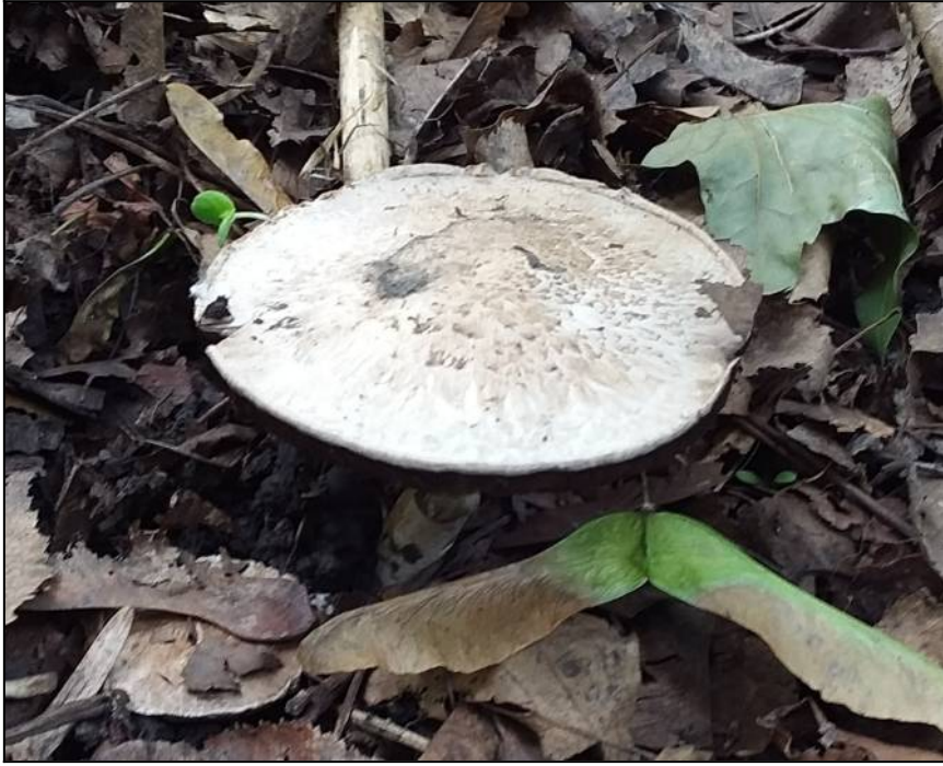
Рис. 31. Шампиньон лесной в месте произрастания