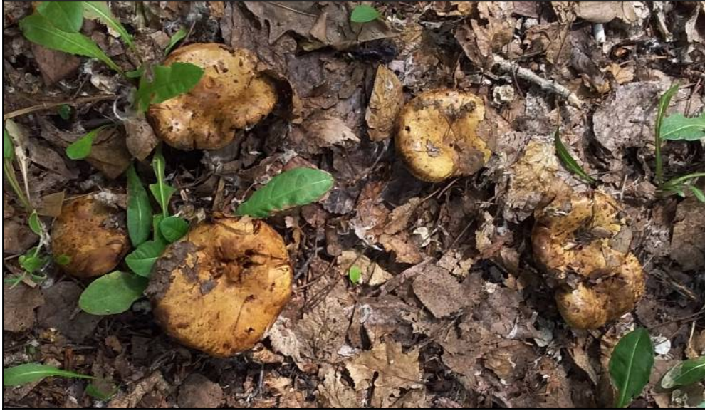
Рис. 14. Свинушка тонкая в месте произрастания