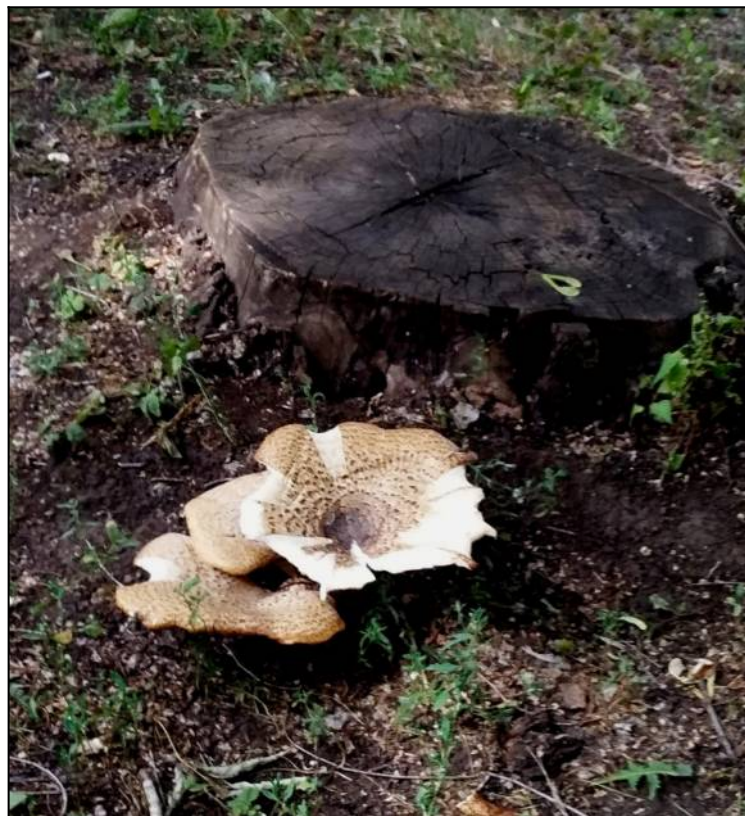
Рис. 9. Трутовик чешуйчатый в стадии спороношения