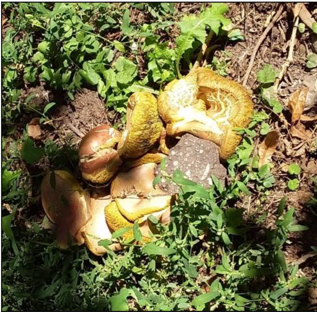
Рис. 15. Моховик трещиноватый в месте произрастания