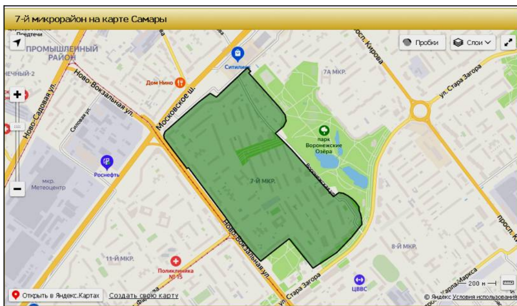
Рис. 1. Седьмой микрорайон на карте Самары (Электронный ресурс)

Физико-географическая характеристика района исследования. Территориально 7 микрорайон расположен в границах ул. Ново-Вокзальной, ул. Стара-Загора, ул. Воронежской, Московского шоссе (Рис. 1). С северо-восточной стороны микрорайон граничит с территорией парка «Воронежские озёра».