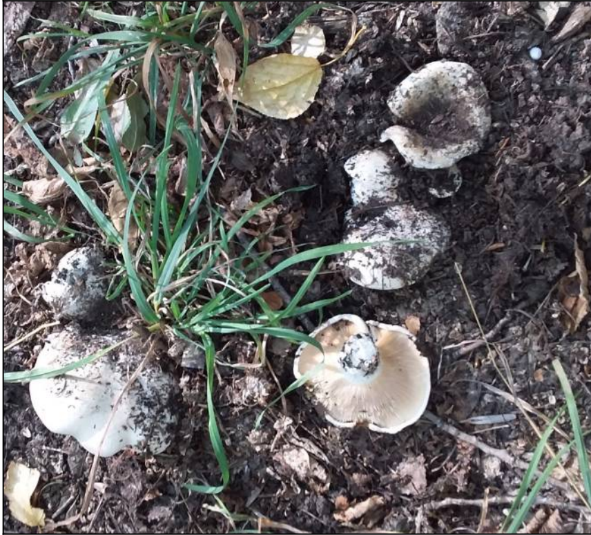
Рис. 21. Подгруздки белые в месте произрастания