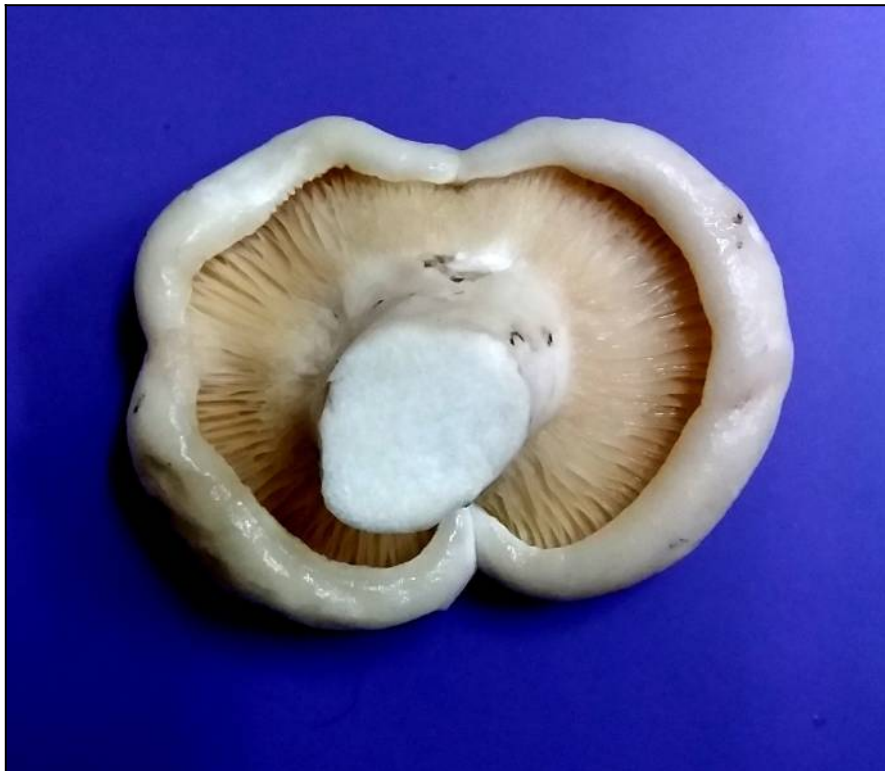
Рис. 40. Груздь войлочный (вид снизу)