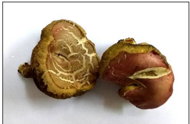
Рис. 16. Моховик трещиноватый (фото для определения)