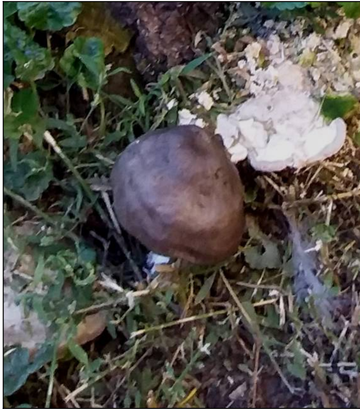
Рис. 10. Плостей олений в месте произрастания