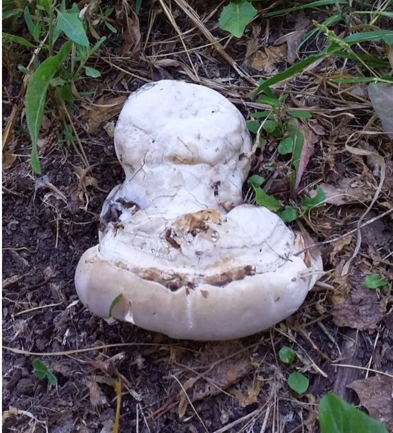
Рис. 37. Трутовик обыкновенный в месте произрастания