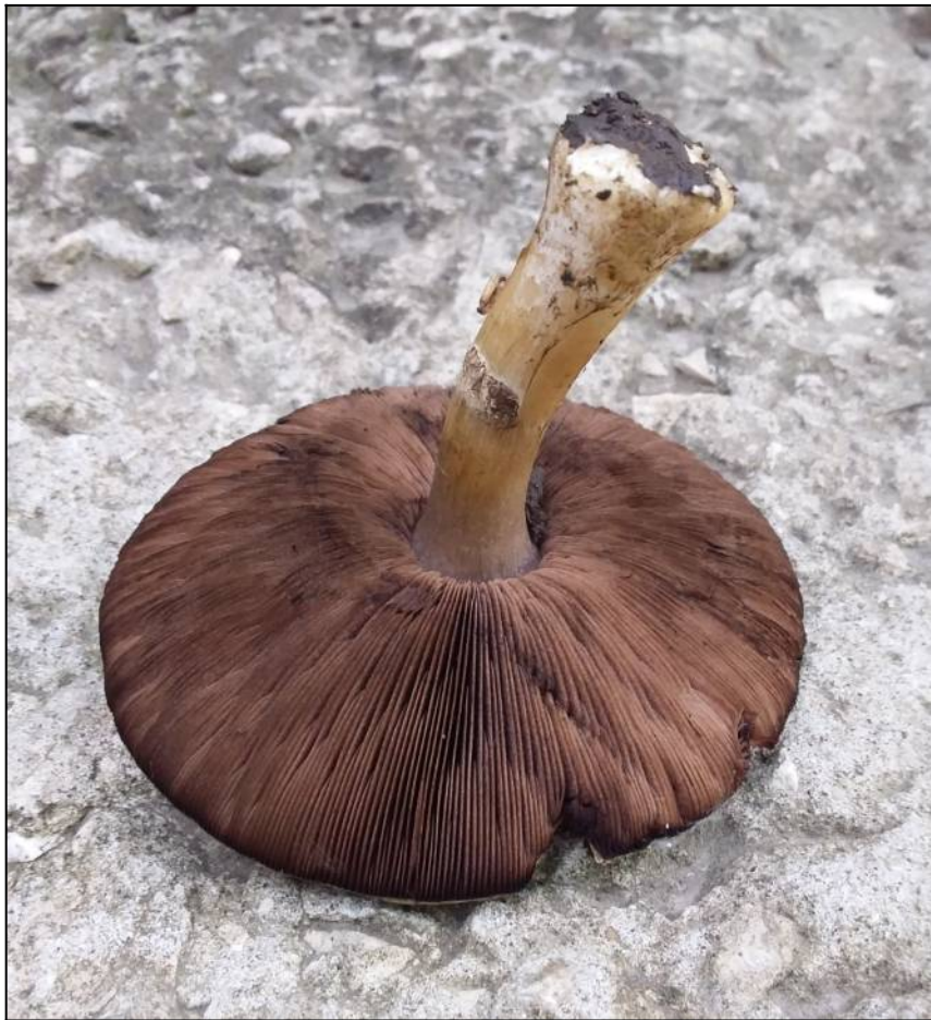
Рис. 32. Шампиньон лесной (вид снизу)