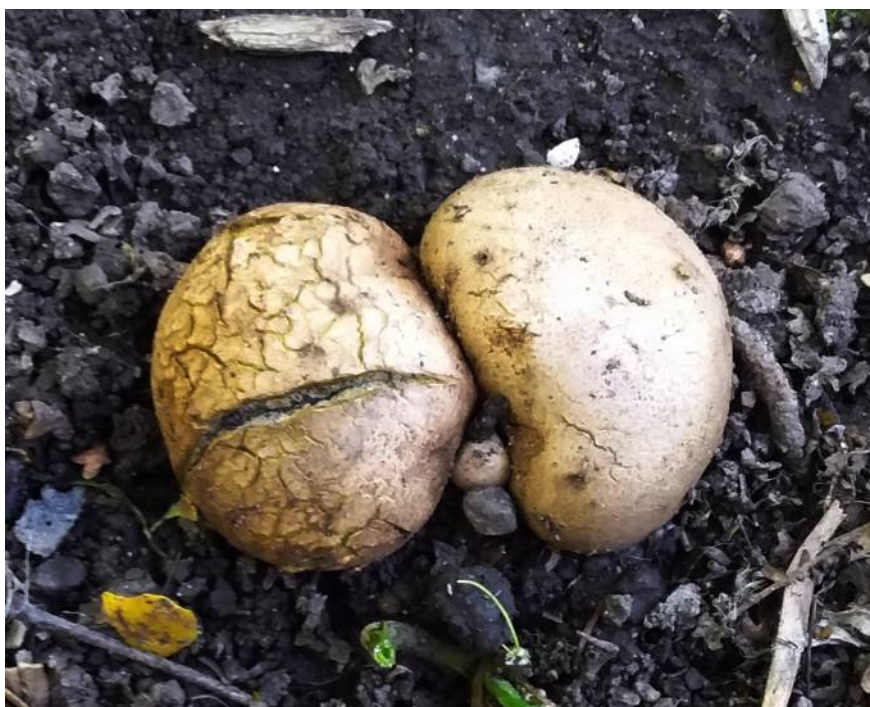
Рис. 35. Ложнодождевик обыкновенный в месте произрастания