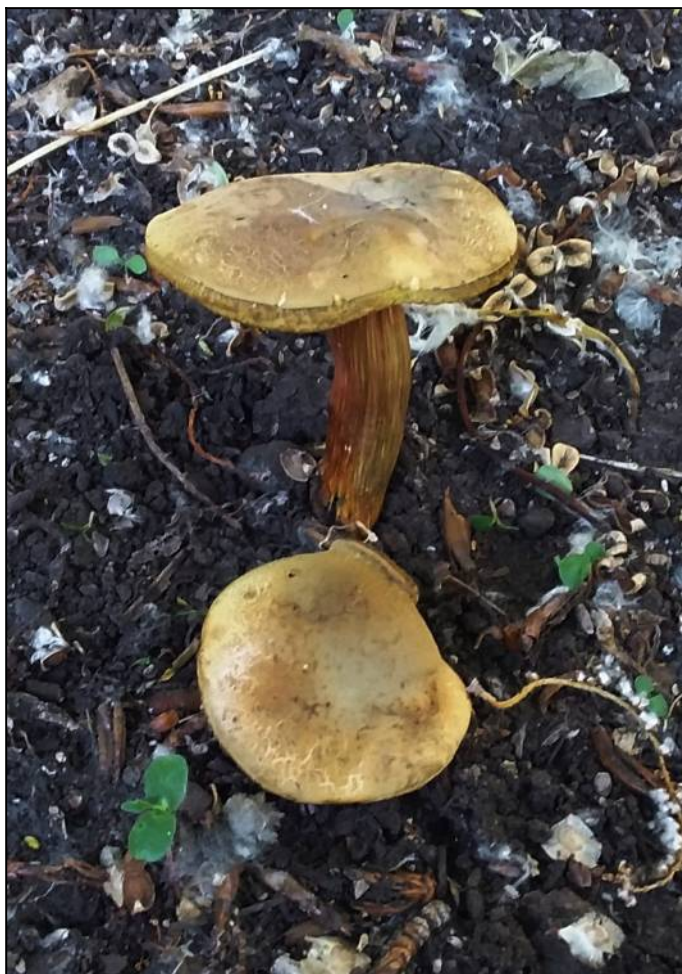
Рис. 29. Моховик зелёный в месте произрастания