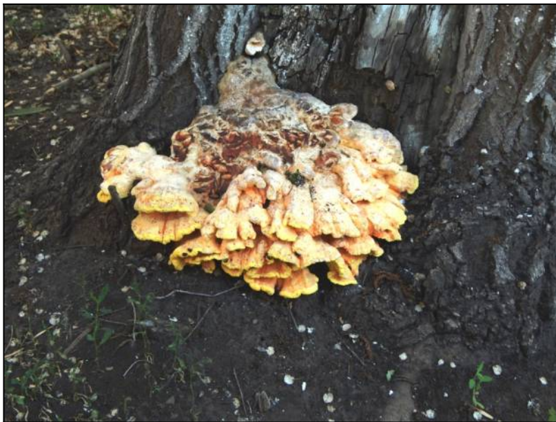
Рис. 7. Трутовик серно-жёлтый в месте произрастания