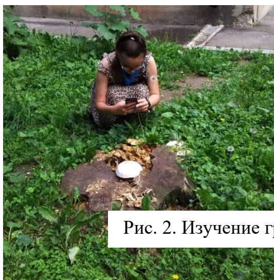
Рис. 2. Изучение грибов на пешеходном маршруте

При обнаружении грибов регистрировались место и декада месяца их обнаружения. Затем производилось фотографирование грибов, и отбирались образ-