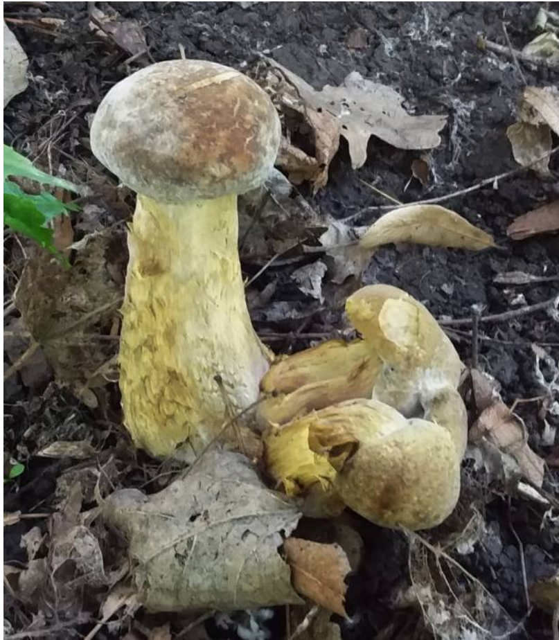
Рис. 33. Дубовик обыкновенный в месте произрастания