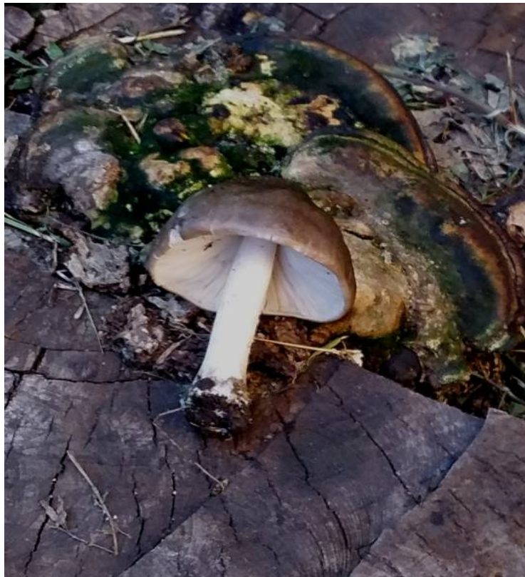
Рис. 11. Плостей олений (вид сбоку)