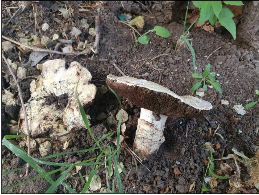
Рис. 23. Шампиньоны двуспоровые в месте произрастания