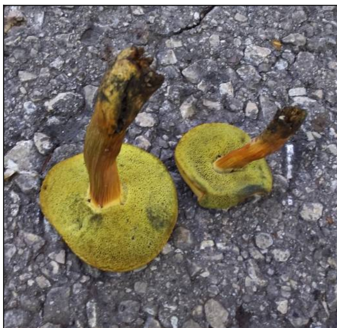
Рис. 30. Моховик зелёный (вид снизу)